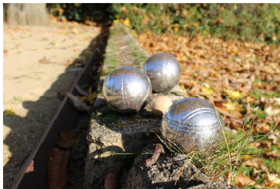
Boule oder Pétanque? Egal, Hauptsache es macht Spaß!